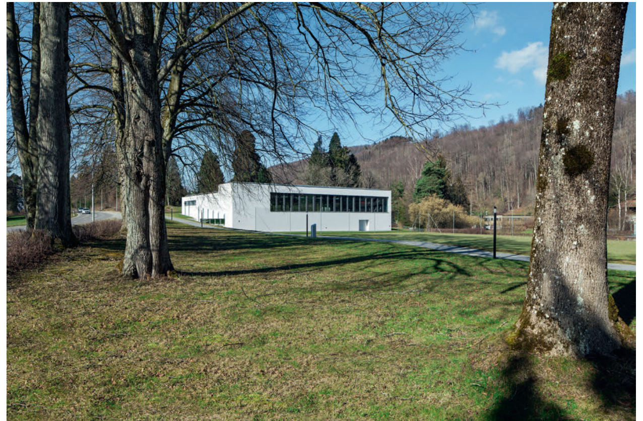
Turnhalle Stiftung Albisbrunn // Hausen am Albis

Für die Umsetzung öffentlicher Bauten stellen das Vertrauen und der enge Kontakt zu den Behörden die Basis für eine reibungslose Projektentwicklung dar. Wir arbeiten seit vielen Jahren erfolgreich in diesem Segment und kennen sowohl die Bedürfnisse und Anforderungen als auch die relevanten Schnittstellen.