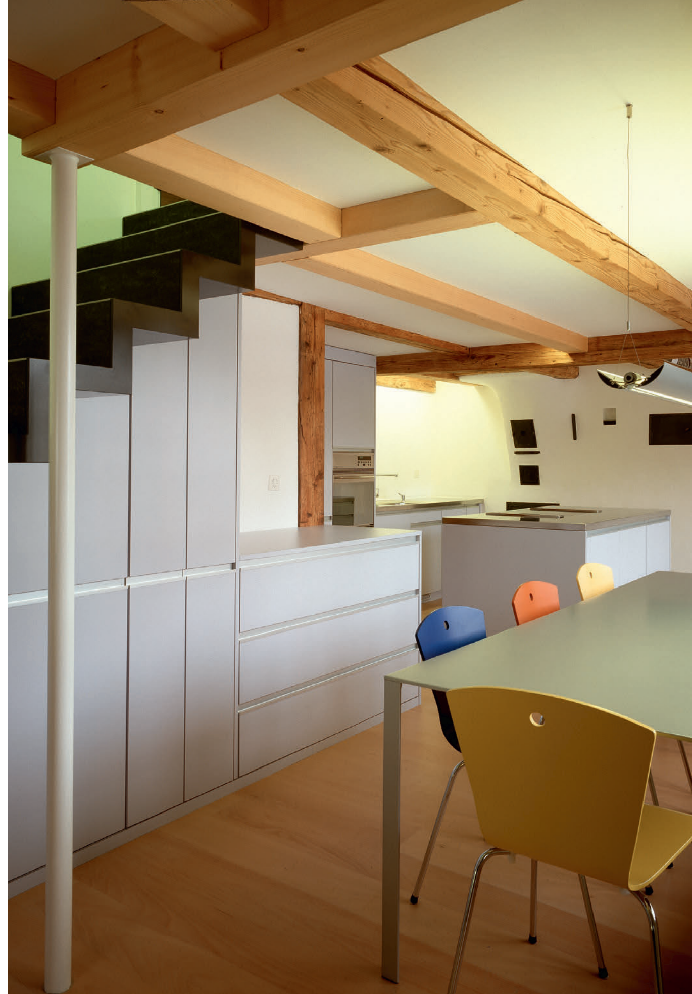
Privates Wohnhaus // Rifferswil

durchgängiges Konzept, das Zweckmässigkeiten, Nutzen und den Charme der Ursprünglichkeit der einzelnen Objekte stilsicher zu kombinieren vermag. Die individuelle Materialisierung und die intelligente Integration von Technik der neuesten Generation spielen in Bezug auf Werterhalt eine wichtige Rolle und erfordern viel Erfahrung und Feingefühl.