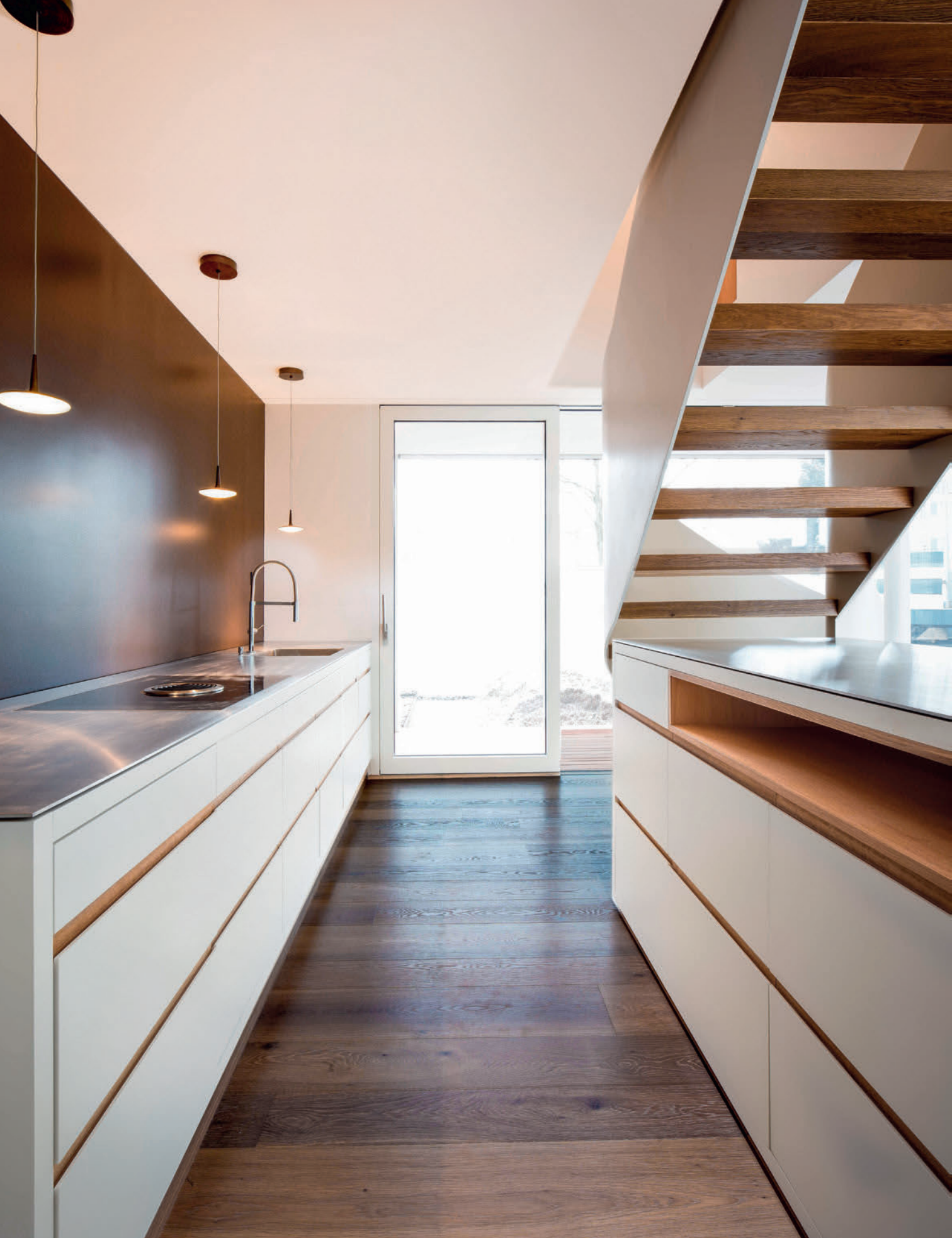
Einfamilienhaus // Letzistrasse, Zug Doppelwohnhaus // Letzistrasse, Zug