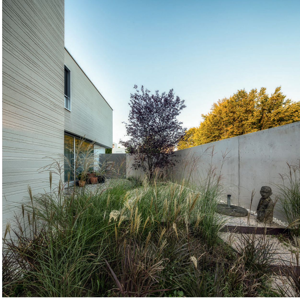
Einfamilienhaus // Letzistrasse, Zug