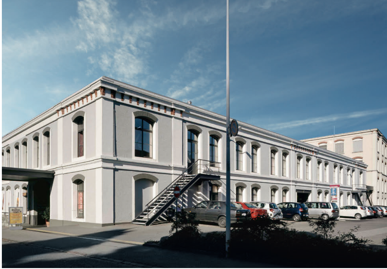
Einkaufszentrum «Di alt Fabrik» // Wädenswil