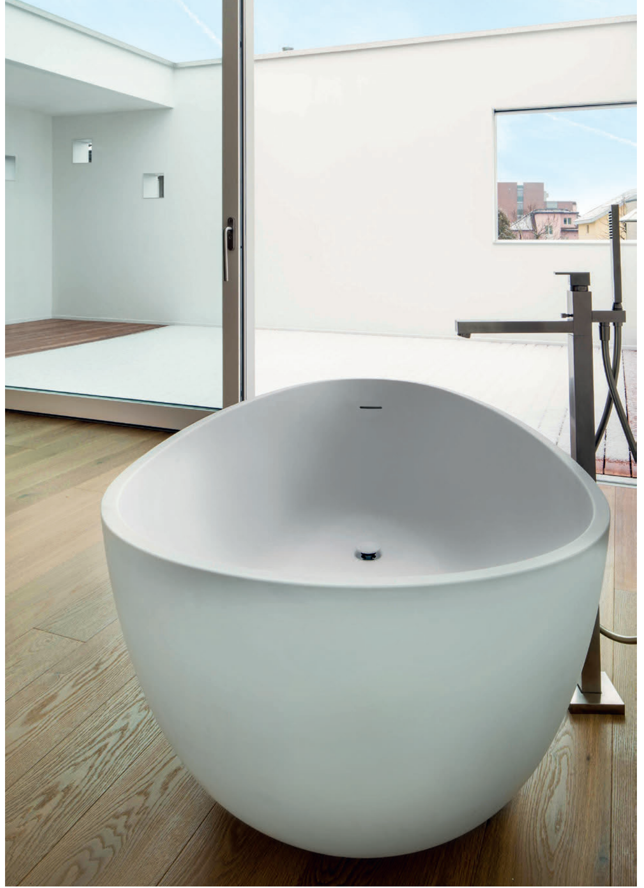
Einfamilienhaus // Letzistrasse, Zug