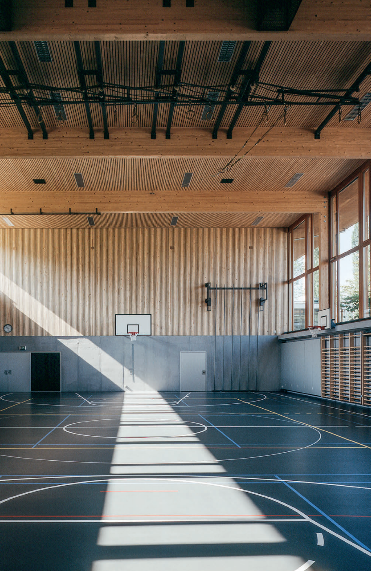
Turnhalle Oberwil // Zug