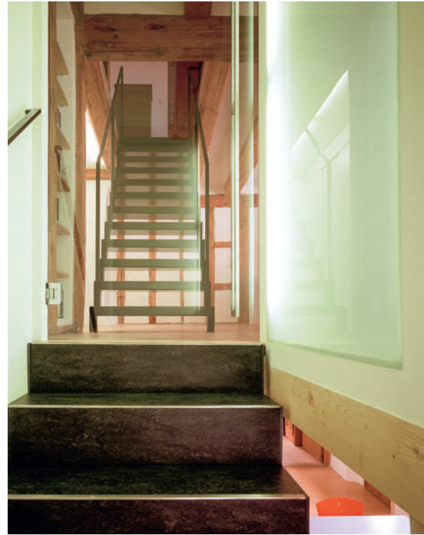
Privates Wohnhaus // Letzistrasse, Zug Privates Wohnhaus // Rifferswil